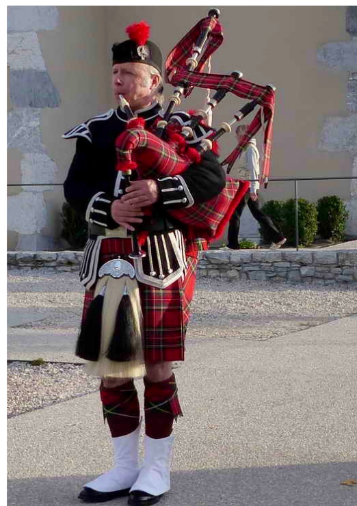
Royal Stewart Modern

Réserver votre date : concerts@ericmclewis.com