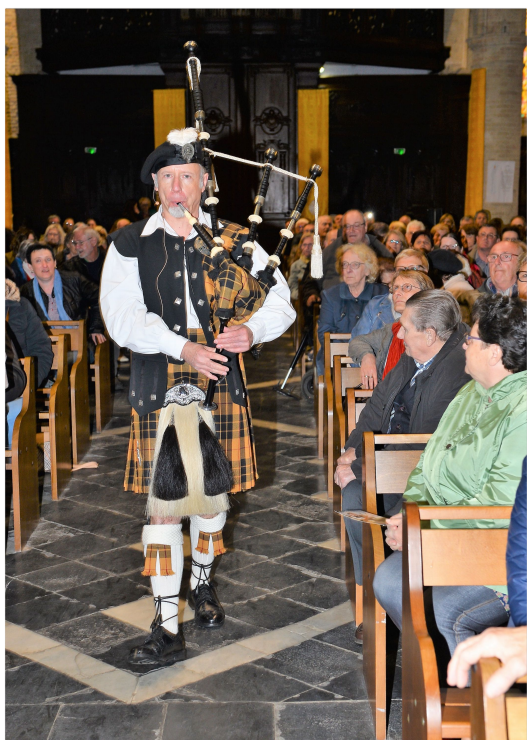
MacLeod Of Lewis

Le costume écossais est complexe, codifié et comporte plusieurs variantes de choix; les tenues et accessoires de costume se déclineront donc selon la prestation. Le kilt reste bien sûr le point commun essentiel!